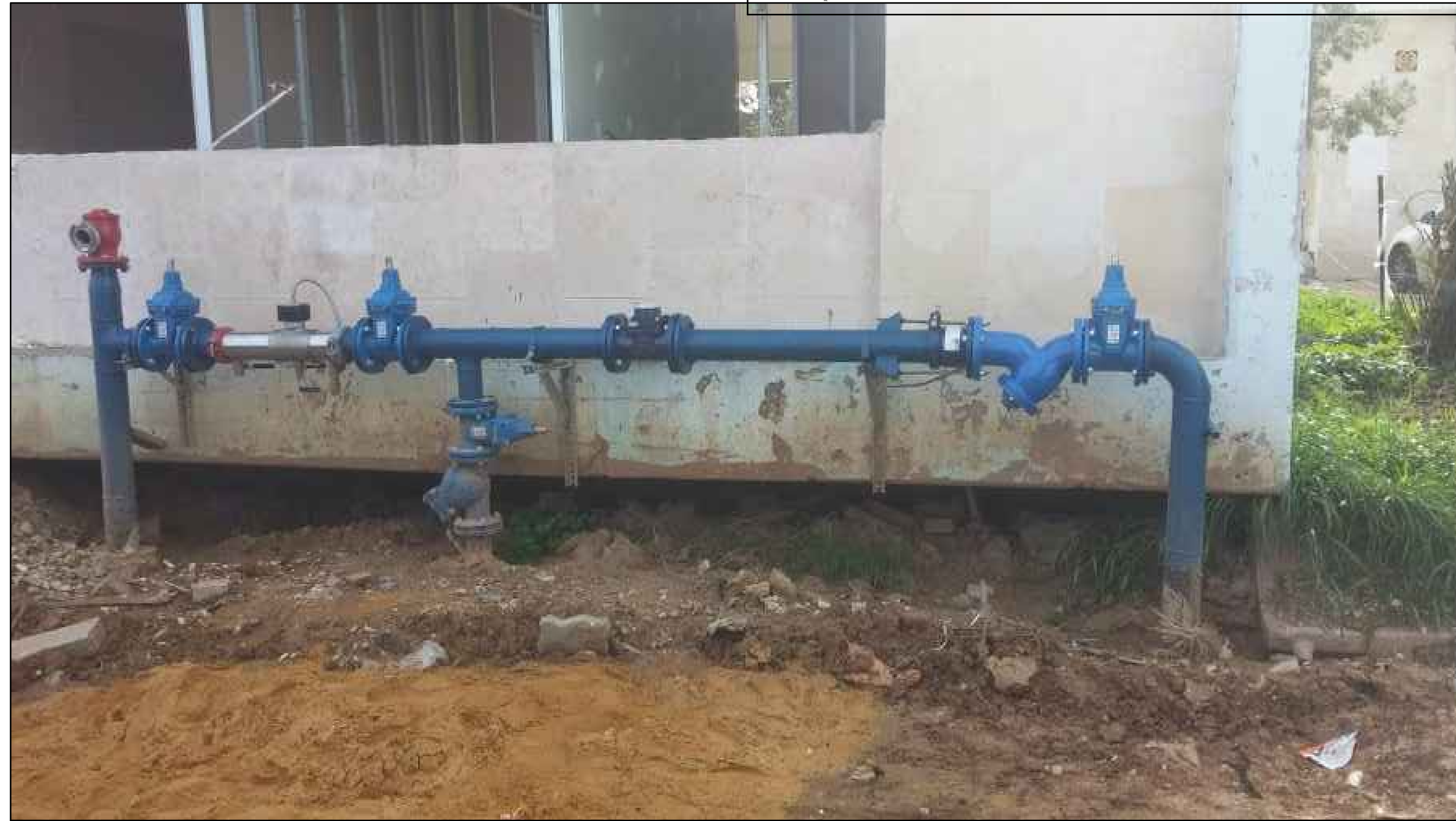
מד מים קיים